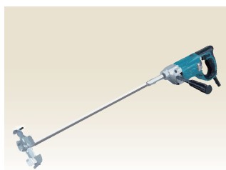
1300rpm以上の高速攪拌機を準備。 φ150のリシン羽根を推奨