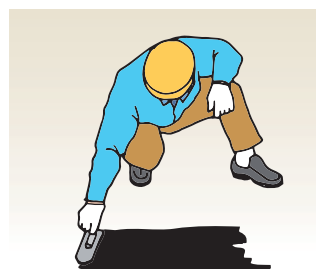
金ゴテ・ハケ等を用いて均一に塗布し、十分に乾燥させてください。