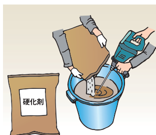
主剤に硬化剤を攪拌しながら徐々に添加し、全て添加し終わってから1分程度攪拌混合してください。 ※2袋目も同様に実施してください