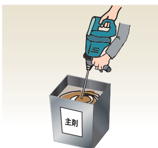
主剤のみ事前に30秒ほど攪拌。 (主剤・硬化剤の混合時には60ℓ程度のポリバケツを推奨)